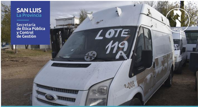
LOTE: 119 A BASE: $2.500.000 (Vehículos: 1)