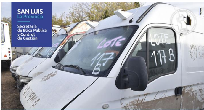
LOTE: 117 B BASE: $2.000.000 (Vehículos: 1)