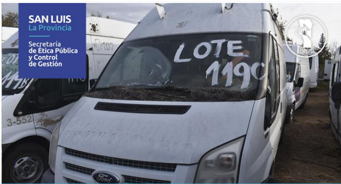
LOTE: 119 C BASE: $ 2.500.000 (Vehículos: 1)