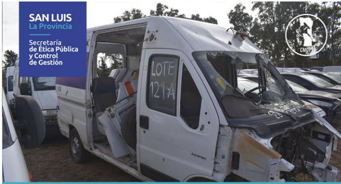
LOTE: 121 A BASE: $500.000 (Vehículos: 1)