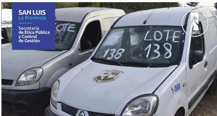
LOTE: 138 BASE: $ 1.800.000 (Vehículos: 2)