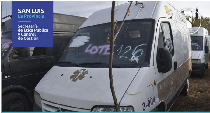
LOTE: 126 A BASE: $1.500.000 (Vehículos: 1)