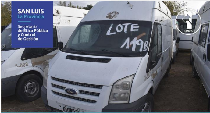
LOTE: 119 B BASE: $ 2.500.000 (Vehículos: 1)