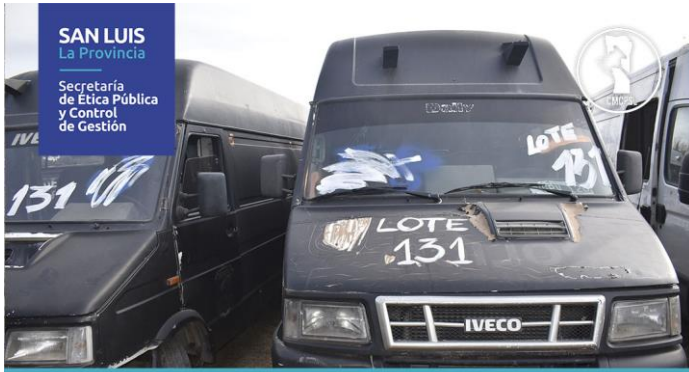
LOTE: 131 B BASE: $ 1.100.000 (Vehículos: 3)