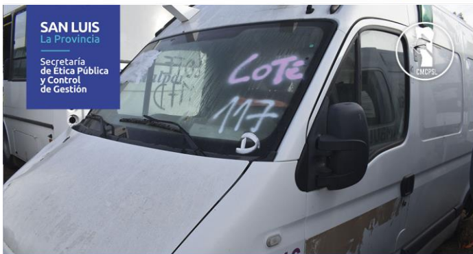
LOTE: 117 D BASE: $1.500.000 (Vehículos: 1)