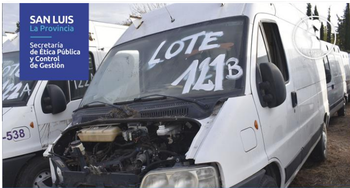
LOTE: 121 B BASE: $1.200.000 (Vehículos: 1)