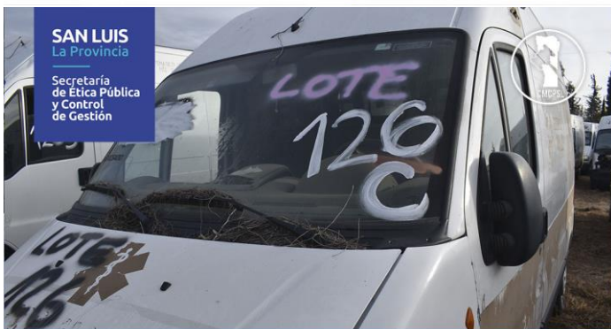
LOTE: 126 C BASE: $600.000 (Vehículos: 1)