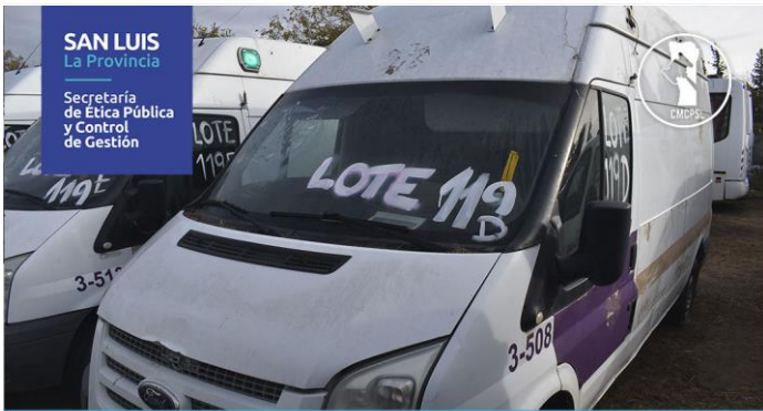
LOTE: 119 D BASE: $2.500.000 (Vehículos: 1)