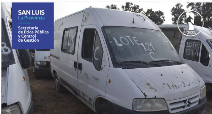
LOTE: 121 C BASE: $ 2.500.000 (Vehículos: 1)