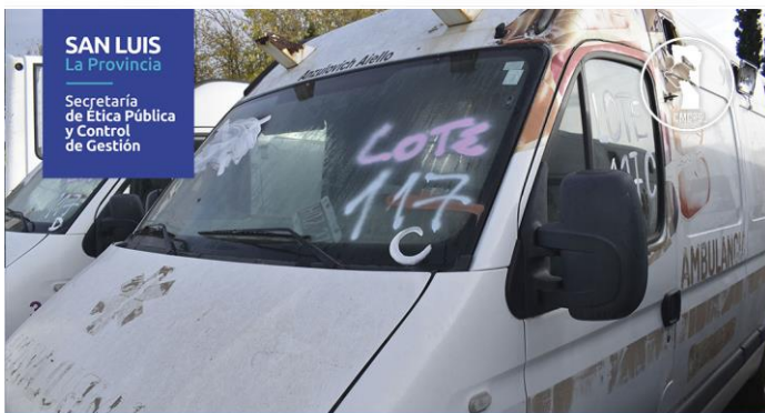
LOTE: 117 C BASE: $2.000.000 (Vehículos: 1)