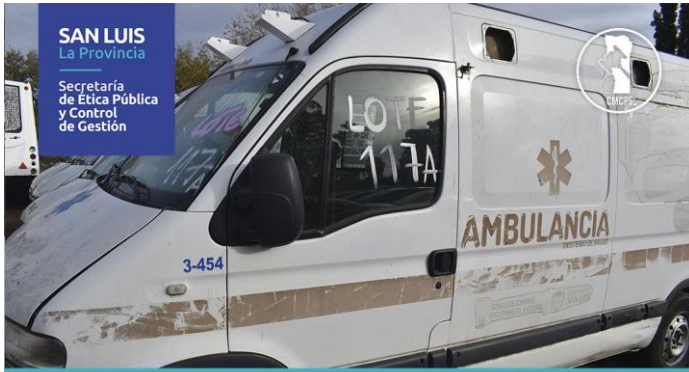
LOTE: 117 A BASE: $2.000.000 (Vehículos: 1)