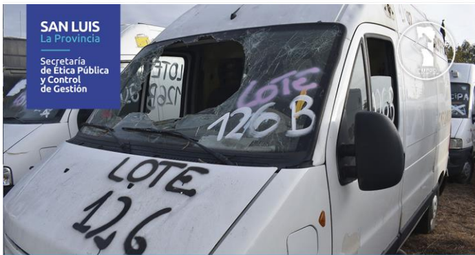
LOTE: 126 B BASE: $900.000 (Vehículos: 1)