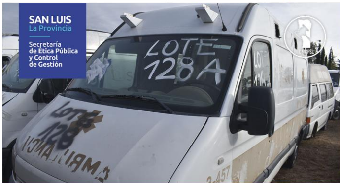
LOTE: 128 A BASE: $1.500.000 (Vehículos: 1)