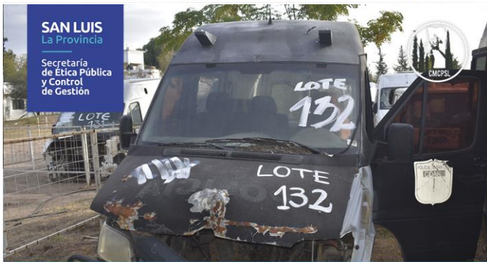
LOTE: 132 BASE: $ 200.000 (Vehículos: 1)