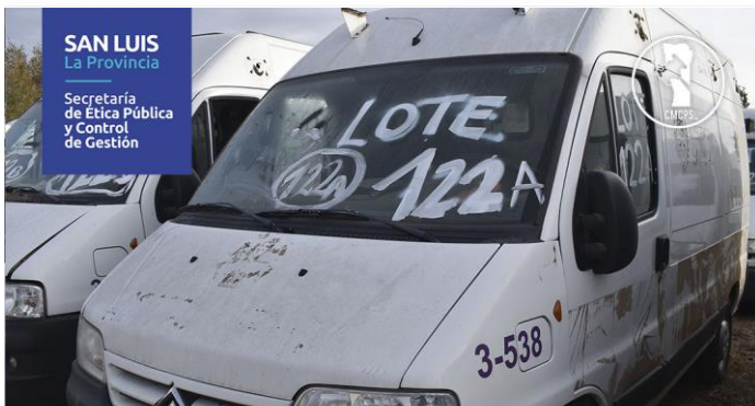
LOTE: 122 A BASE: $2.500.000 (Vehículos: 1)