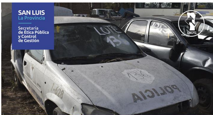
LOTE: 136 BASE: $ 400.000 (Vehículos: 2)